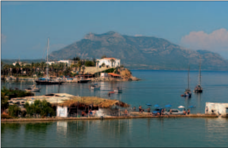
Die Bucht von Datça