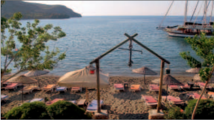
Die beschauliche Haytübükü-Bucht

schen den Wassertanks und der Quelle rechter Hand Ausschau. Die ersten Markierungen sollten nach ca. 30 m Anstieg zu sehen sein. Kurz darauf machen ein paar umgestürzte Bäume Schwierigkeiten bei der Wegsuche. Halten Sie hier nach Steinpyramiden Ausschau. Nach ca. 1 ½ Std. sollten Sie den Sattel, den höchsten Punkt der Wanderung, erreicht haben. Von der Kargi-Bucht gelangen Sie über das Küstensträßchen nach Dağça.